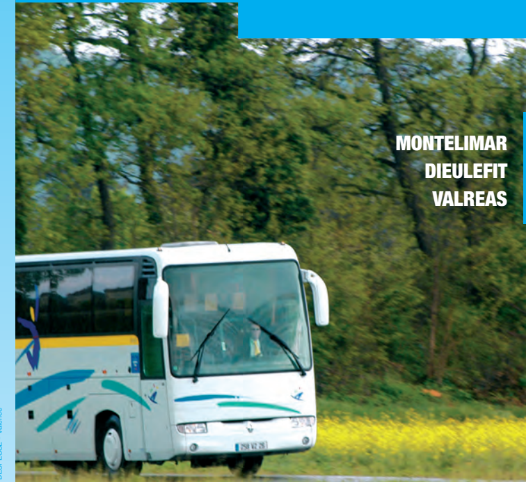
Impression DESPESSE - Valence

Nota : Aucun service ne circule les 25 décembre, 1 er janvier, 1 er mai.